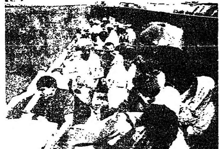
مصريون داخل عربة لنقل الغوثي على الحدود الأردنية - العراقية